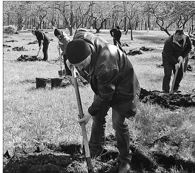
Новий сад зростає й наповниться новими піснями

Директор поінформувала, що музейна акція триватиме й надалі. До 300-річчя Григорія Сковороди на території Національного літературно-меморіального музею заплановано висадити 300 саджанців.