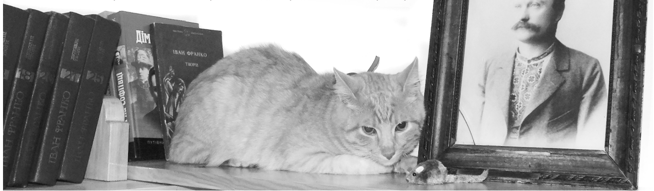
Мурлика вже облюбив для себе «пост»

Отож новому керівникові дуже хочеться, щоб музей був не лише меморіальним будинком славетного письменника, вченого, громадського та політичного діяча, а й домом, де було б затишно, привітно, тепло його відвідувачам. А таке місце пов'язане, звісно, із тваринами.