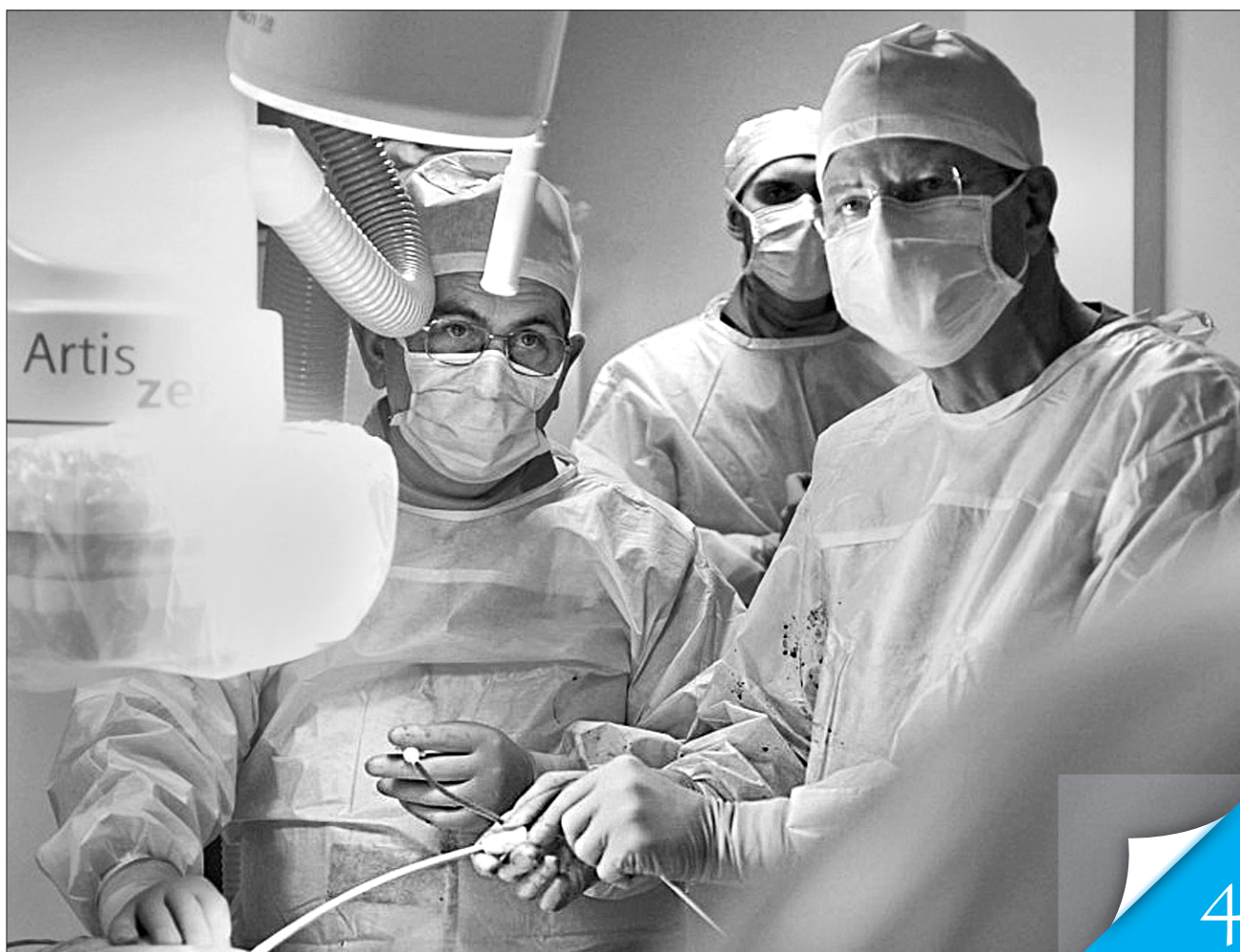
Кардіохірурги Ілля Ємець (ліворуч) та Редигер Ланге (праворуч) виконали першу в світі ендоваскулярну заміну мітрального клапана людини

ІНІЦІАТИВА. Національна академія наук і Центр дитячої кардіології та кардіохірургії разом працюватимуть над програмою «Довголіття-кардіо»