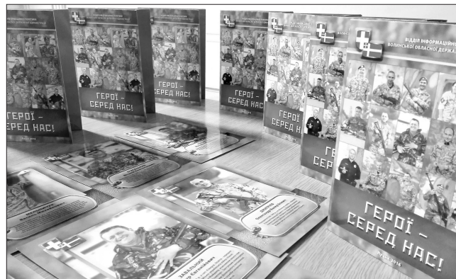
Патріотичну атрибутику слід використовувати якнайширше