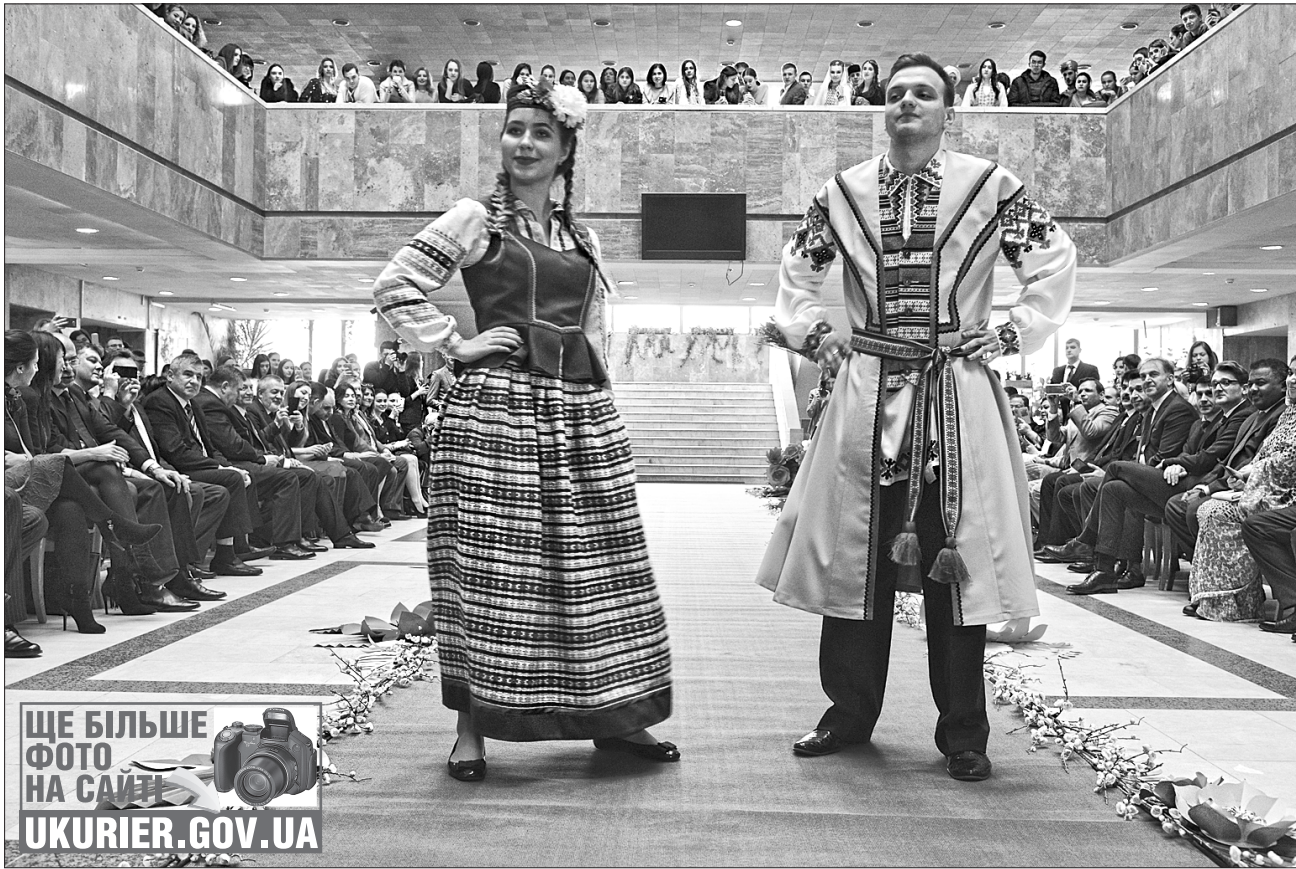
ЩЕ БІЛЬШЕ ФОТО НА САЙТІ UKURIER.GOV.UA

РОЗМАЇТА ІДЕНТИЧНІСТЬ. У переддень весни майбутні дипломати, студенти Інституту міжнародних відносин Київського національного університету імені Тараса Шевченка, зійшли на подіум: вони взяли участь у показі національних костюмів, організованому проектом Outlook, який працює у сфері культурної дипломатії, Інститутом міжнародних відносин Київського національного університету імені Тараса Шевченка та благодійною організацією «Фонд розвитку Інституту міжнародних відносин».