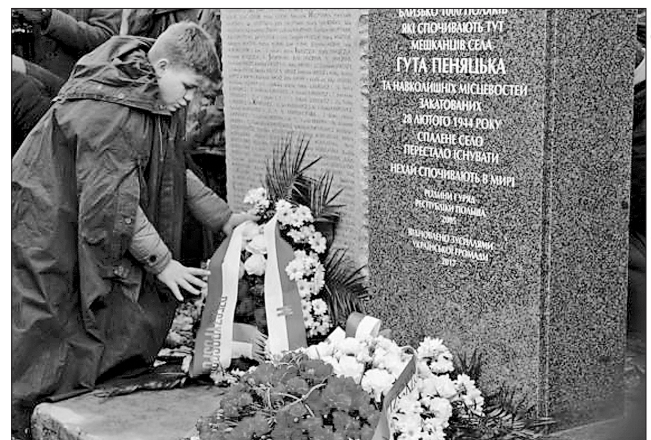
На меморіалі загиблих під час Другої світової війни в Гуті-Пеняцькій знову квіти

Олег Синютка на громадському вічі зазначив, що маємо нині спільного ворога, який вибухом пам'ятника в Гуті-Пеняцькій хотів підірвати польсько-українську дружбу. Очільник області щиро подякував тим людям, які долучилися до відновлення меморіалу, й висловив сподівання, що це стане добрим прикладом до відновлення українських пам'ятників, які недавно зруйнували в Польщі. Як повідомили у прес-службі ОДА, на важливості дружніх відносин між двома державами наголосив Надзвичайний та Повноважний посол Республіки Польща в Україні Ян Пекло. Він підкреслив, що третя сторона намагається нас посварити, тому необхідно робити все можливе для покращення польсько-українських відносин в усіх сферах.