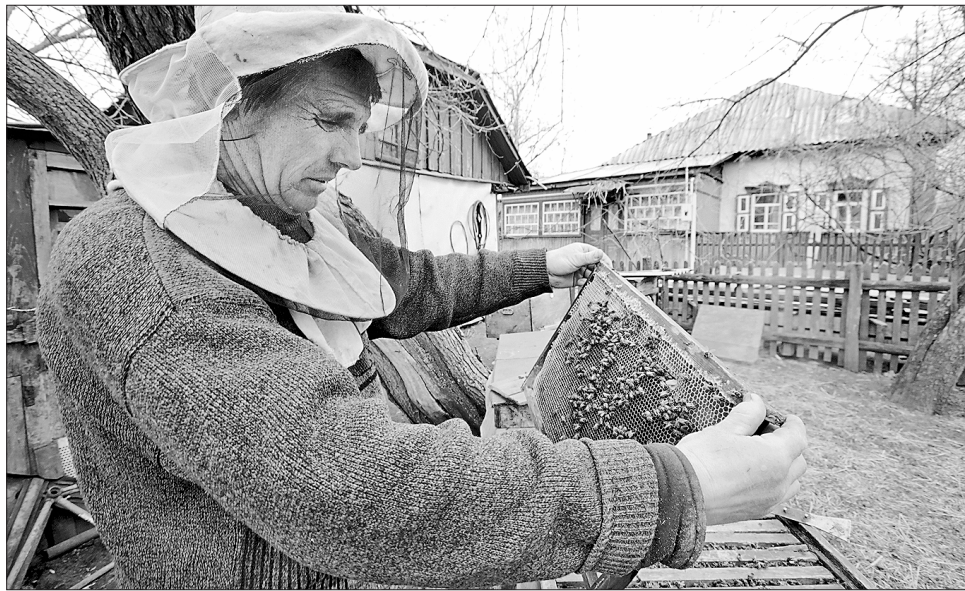
Пасічники незабаром зможуть пересвідчитися як перезимували їхні годувальниці

На Євдокії старі люди не лише спостерігали за прикметами природи, а й проводили обрядові дійства. Зокрема готували з чистого снігу талу воду і вмивали нею дітей, хворих — на здоров'я, на силу. Також напували нею худобу, птицю. Жінки цього дня замовляли пороги, щоб захистити помешкання від пересудів і лихого ока. На порозі стояти не можна — застоїш добробут. Через порі