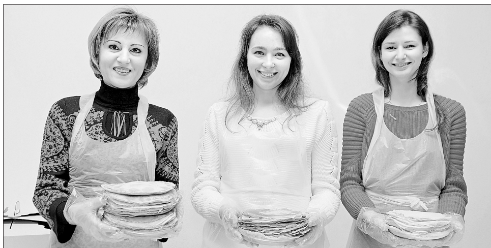
Жінки Дніпропетровської ОДА приготували і передали на фронт смачну «секретну зброю» для українських захисників

Свіжоспечену вдома смакоту жінки принесли на роботу,