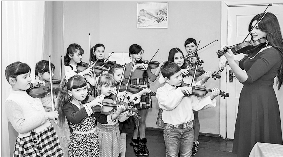
Клас скрипки — один з найпопулярніших у селищній музичній школі

Ініціатива «Спільними зусиллями досягнемо успіхів» посправжньому згуртувала людей. Саме завдяки цьому 72 учні з усіх населених пунктів ОТГ, які успішно пройшли прослухову-