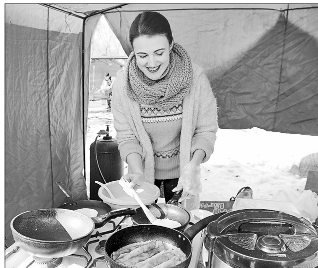
Ужгородські дівчата знаються і на частуванні, й на чаруванні