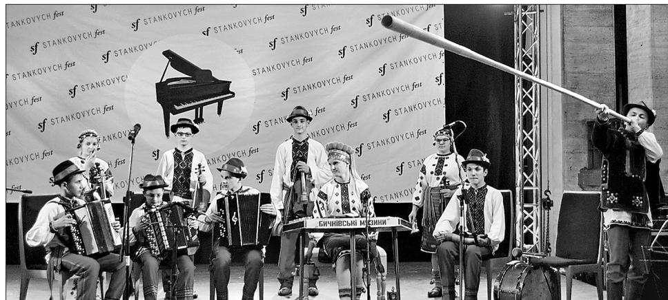
Євген Станкович добре знає, яким невичерпним джерелом для композитора є звуки народних інструментів

На Свалявщину, де народився метр, для участі в міжнародному конкурсі приїхали тисячі виконавців, які змагалися в чотирьох вікових категоріях — від 5 до 25 років, а також у трьох номінаціях: музичне, хореографічне та образотворче мистецтво. Була й родзинка фесту — виявлення найкращих юних композиторів.