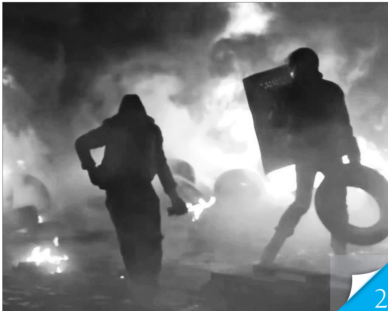
Кадр із фільму «Переломний момент. Війна за демократію в Україні»

НАША ГІДНІСТЬ. Американські університети очікують на перегляд фільму про український спротив як на посібник із сучасної історії