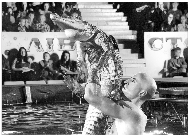
Демонстрація рептилій — один із найдавніших циркових номерів

НОВА ПРОГРАМА. Нинішню весну Національний цирк України зустрічає у незвичний спосіб — його арена перетворюється на басейн із фонтанами. Звісно, якщо вода заводить дружбу з вогнем (про це яскраво свідчать спецэффекти в номерах), про класичний стиль подачі програми не може йтися. Раніше під склепінням лунав дитячий сміх, нині тут панує зосередженість та певна невизначеність. Більшості глядачів — як маленьким, так і дорослим — вистава на воді видалася дивовижним та незвичним дійством. У ньому навіть клоуни жартували на європейський штиб, хоч насправді створювали дійство виключно українські профі циркового