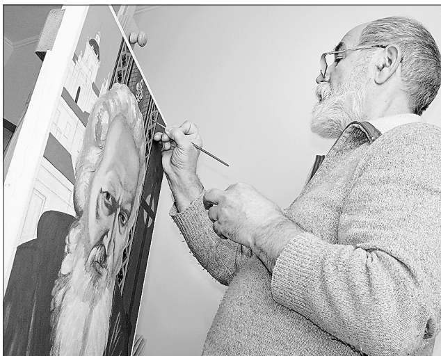
Народний художник України Богдан Ткачик творить образ митрополита Андрея Шептицького праведного

Серед численного чоловічого гурту іконописців була і Марічка Тимчук-Шевчук. Вона, як і торік, взялася за написання ко-