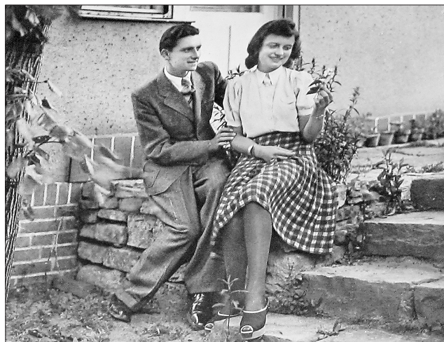
Це освідчення навіть закарбували на листівці