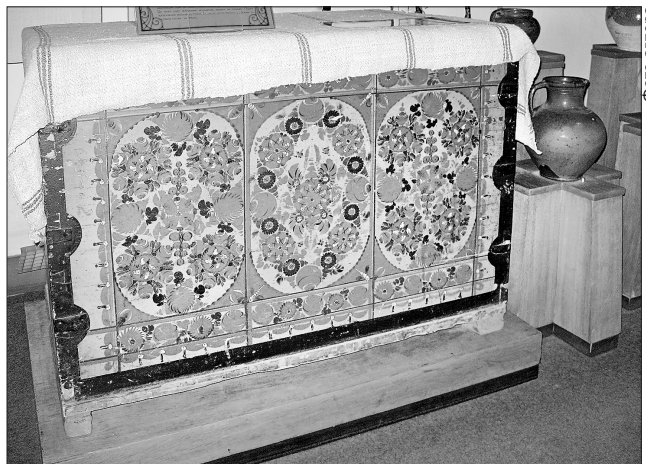
Скриня для нареченої з петриківським розписом — запорука щасливого заміжжя

Він наголосив, що федерація докладатиме максимальних зусиль, щоб домогтися позитивного вирішення питання Романа Зозулі: забезпечити нашого збірника ігровою практикою. Футболіст, який є патріотом своєї країни, не повинен страждати через свою громадянську позицію. Адже позафутбольна діяльність Романа — це привід для національної гордості. Зозуля завжди виявляв свою громадянську свідомість! Створив фонд допомоги військовим, які захищають свою країну на сході України «Народна Армія». Крім цього, за свої гроші допоміг відремонтувати госпіталь у Дніпрі, де проходять реабілітацію поранені військовослужбовці української армії. На думку очілька ФФУ, кандидатура Зозулі одностайно підтримають на конгресі футбольної федерації в квітні. Нині посаду офіційного представника діючих гравців обіймає Анатолій Тимошук, який повідомив про рішення завершити ігрову кар'єру.