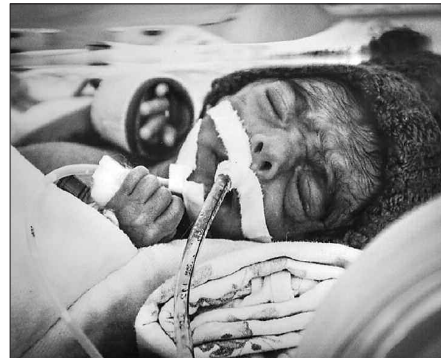
Благодійність дає надію дітям у різних життєвих ситуаціях: і немовляті зі світлинами Ніни Грушецької, і хлопчиків з Лисичанська, якого Костянтин Скомоорох сфотографував з дорогою знахідкою