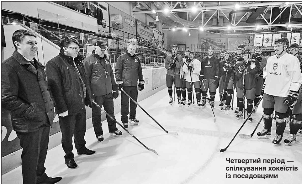
Четвертий період — спілкування хокеїстів із посадовцями