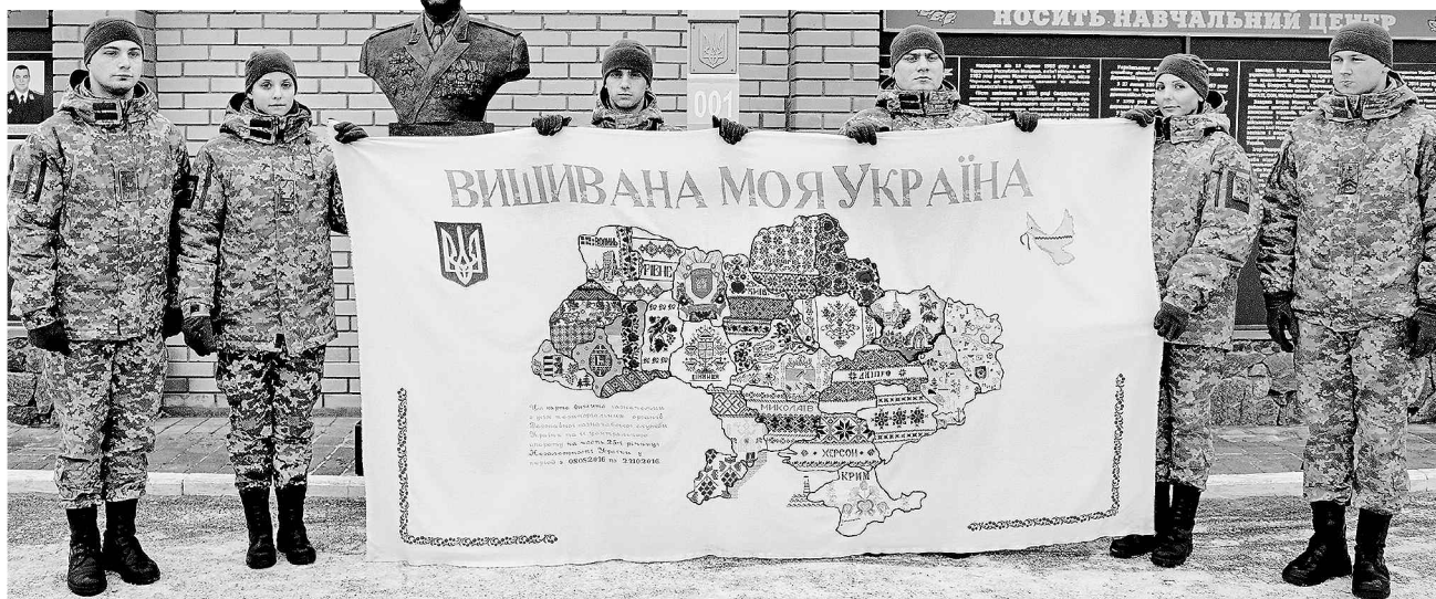
Майбутні прикордонники з цікавістю ознайомилися з картою і висловили готовність захистити кордони рідної країни

Результатом всеукраїнської казначейської акції «Вишивана моя Україна» став справжній шедевр, виготовлений руками народних талантів. Прикордонники впевнені, що карта-оберіг, яку виготовляли з думками про мир та спокій, ніколи не змінить кордонів і стане символом єднання та злагоди.