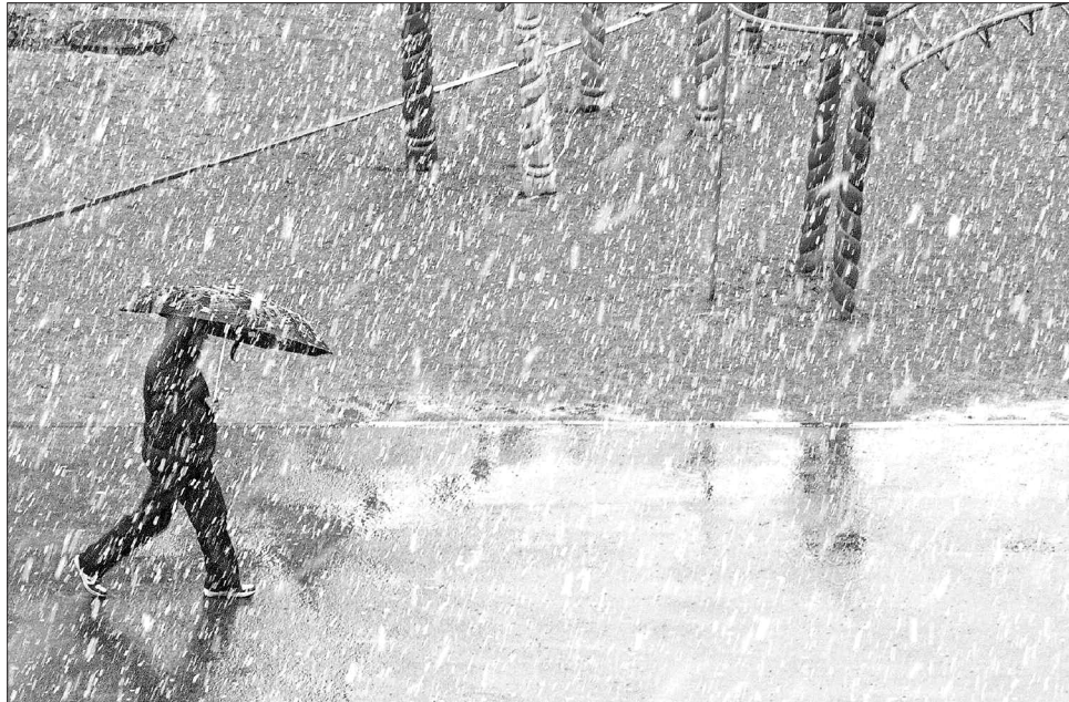
Останній зимовий місяць дволикій: і морозом налякає, і теплом приголубить; то січнем потягне, то березнем прозирне

Тимофієві на п'яти наступають Ксенія-Веснопровісниця (6) і Трохим-Перезимник (14). Господарям слід готуватися до зустрічі весни: перевірити, чи висаються зимових запасів для себе і для худоби, у якому стані насіння збіжжя. Якщо день на Оксани теплий, хмари плывуть високо — весна буде теплою, а гарна погода утримається до кінця місяця. Старі люди кажуть: «Яка Оксана, така й весна». Інше прислів'я стверджує: «Оксана дорогу кує, а Трохим псує». Це означає, що морози ідуть на спад, настає помітне потепління. Від Трохима повсюдно зникає сніжний покрив, на осонні з'являються проталіни. Трохим-Перезимник поспішає на велике урочисте свято зустрічі весни — Стрітення Господнє. У храмах цього дня відбуваються велелюдні богослужіння, парафіяни освячують воду та свічки, які після цього стають оберегами. Стрітенською свічкою на одвірках помешкань ставлять хрестик, «щоб хату стеріг і злі сили не пускав на поріг». Крихту воску від цієї свічки беруть із собою як оберіг ті, хто виру-