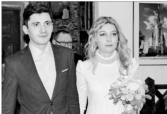
Молодята «за 24 години» взяли шлюб у Луцькому замку