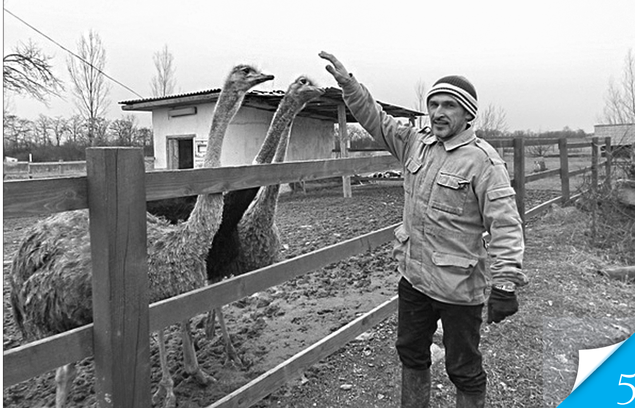
Соціальний розвиток села не можливий без підтримки державою дрібних товаровиробників

АКТУАЛЬНО. Більшість із запроваджених з нового року для сільгосптоваровиробників адмінновацій позитивні. У зоні тривоги — заміна спецрежиму ПДВ бюджетними дотаціями