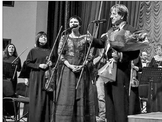
Концерт у Северодонецьку під керівництвом диригента Курта Шміда традиційно пройшов із аншлагом

Концерти Курта Шміда завжди збирають аншлаги, і публіка щиро чекає на зустрічі, а про музикантів та солістів оркестру годі й казати. Завдяки підтримці пана Курта у 2015 році оркестр відновив діяльність у Северодонецьку, перемістившись з окупованого Луганська. І перший концерт на два відділення відбувся вже через 2 місяці після відновлення — 7 травня 2015 року. Торік оркестр виїздив на гастролі в Австрію й виконував українсько-австрійську програму у Відні. Тепер на митців чекають нові творчі зустрічі.