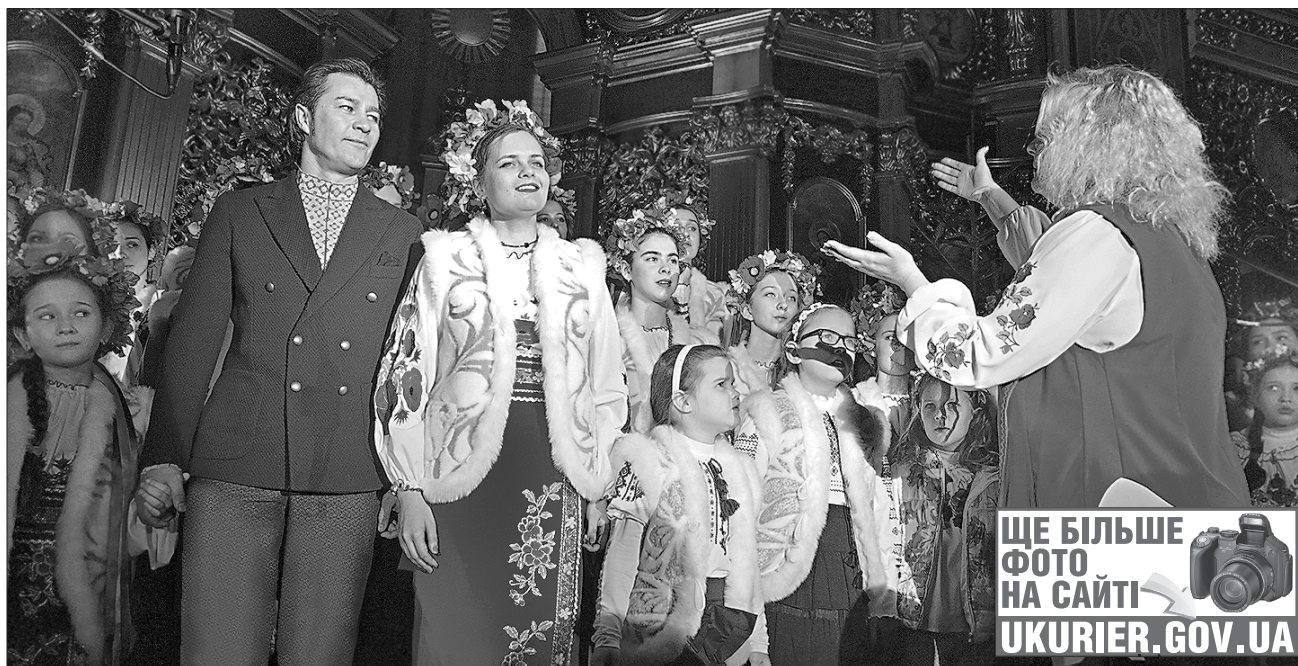
Долучився до пісенспіву і міністр культури Євген Нишук

ведені спільно з Михайлівським до дня Святого Миколая. Зібрані на фестивалі кошти передадуть трьом дитбудинкам Луганської і Донецької областей. До речі, рахунок у «ПриватБанку» ще не закрито і ті, хто не зміг побувати на «ЕтноЗимі» можуть зробити свій внесок.