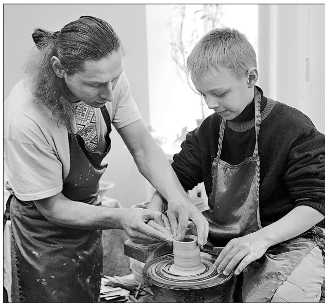
Гончарний круг як засіб виховання довів ефективність