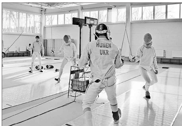
У запеклій боротьбі стають чемпіонами

Грандіозний проект — будівництво в парку спортивного майданчика з фехтувальним комплексом — влада замислила ще у 2013 році. Втім, комплекс для фехтування так і не було відкрито вчасно, адже скінчилися кошти, надані на той рік. Наприкінці 2013-го готовність об'єкта становила 40 відсотків. Це перший в Україні фехтувальний зал, який будували з нуля. В проект врахо-