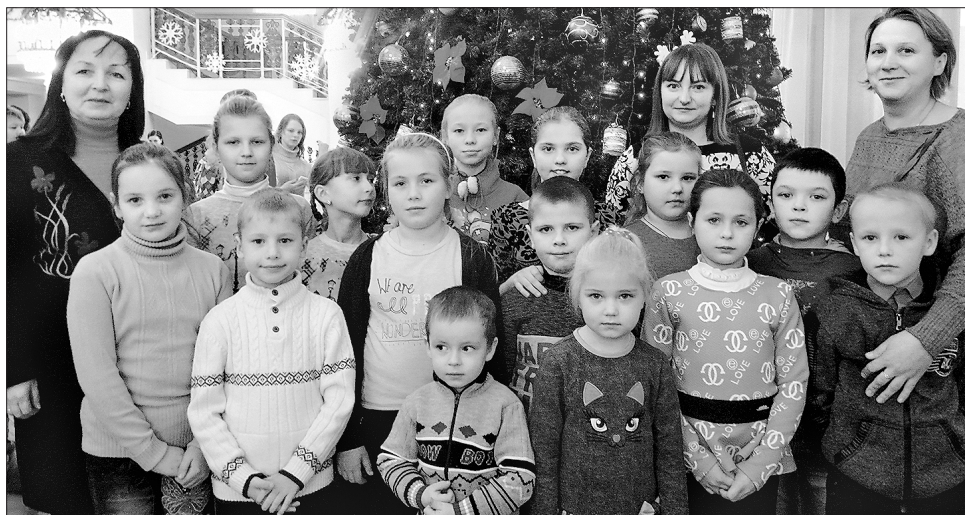
Дітвора ялинкою в театрі задоволена

Простора зала, гарні декорації, безпосередній контакт із виконавцями головних ролей — символом року Півнем, Дідом Морозом та Снігуронькою, які хоч уже й потрапили під декорумінізацію, цього року ще завітали до дітей, — все це стало певною віддушиною у перед-