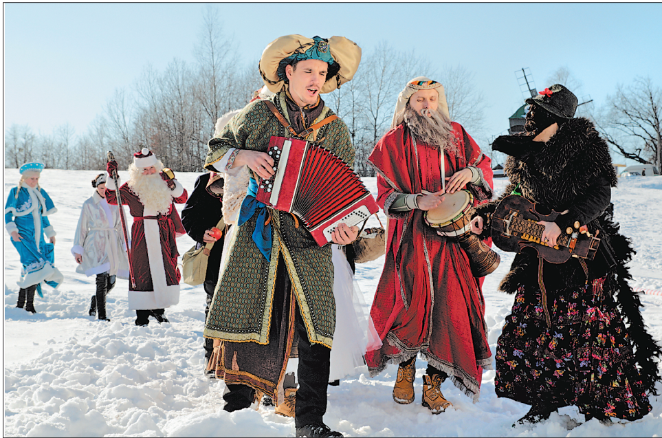
Разом з побажаннями від вертепів до хати заходить добро

Першими провісниками народження Христа були діти і підлітки. Ця традиція дійшла до наших днів. Удосвіта семи-восьмирічні хлопчики та дівчатка вітають родичів і сусідів зі святом Різдва Христового. Щиро відкривайте двері перед посівальниками, щедрувальниками, колядниками, які в ці дні віншують вас зі святами.