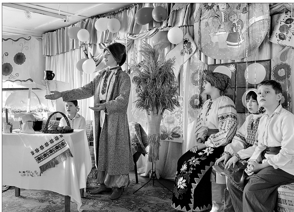
Дійство у світлиці розчулило навіть необізнаних з українськими традиціями

Найціннішою в цьому передноворічному уроці чуйності була ідея добра,