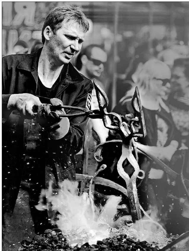
Кожен коваль-патріот має викувати тризуб

Новачі прикарпатців належно поціновані організаціями цьогорічного загальноукраїнського конкурсу «Кращі практики в місцевому самоврядуванні», який проводить вітчизняний Мінрегіонбуд у співпраці з Програмою Ради Європи «Децентралізація і регіональна консолідація в Україні». Івано-Франківська міськрада цілком слушно відзначена Дипломом I ступеня за темою «Стимулювання економічної активності, створення робочих місць».