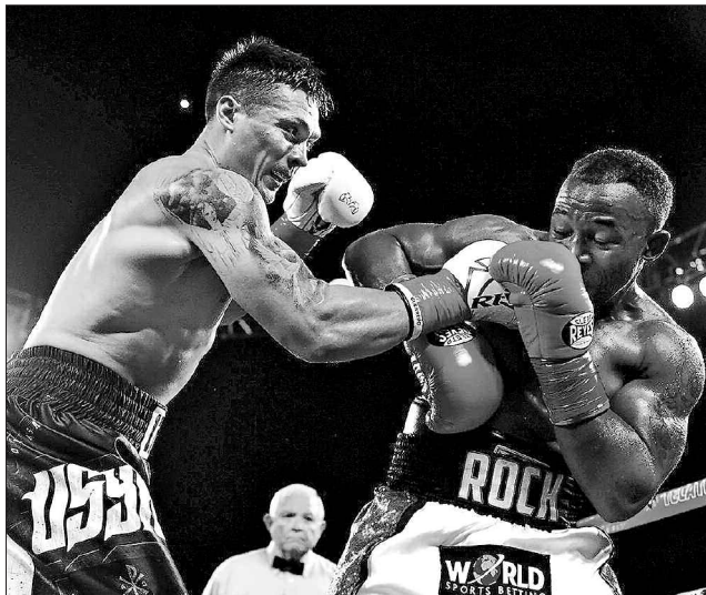
Мчуну вистачило на вісім з половиною раундів

Наш козак домінував протягом усього поєдинку. Після першого нокадауну південноафриканця (у шостому раунді) Олек-