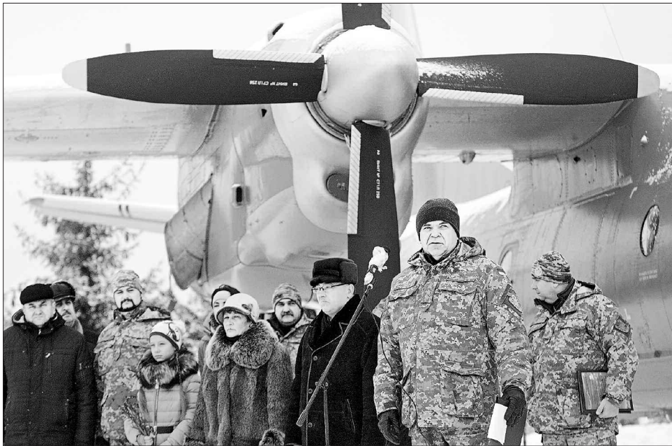
Рідні Дмитра Майбороди, військові та вінницькі посадовці благословили крилатого санітара на нову службу

Урочиста передача літака відбулася за участю рідних Героя України Дмитра Майбороди, керівництва області і міста та складу бригади транспортної