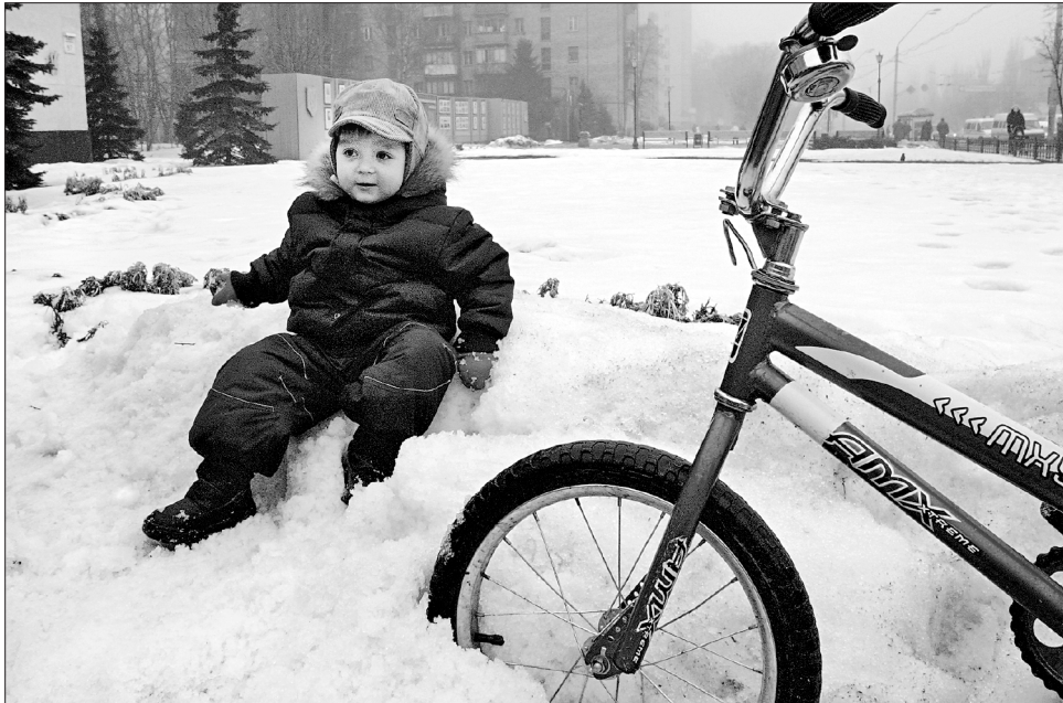
Сніг, який випав на початку цього тижня, можна вважати перехідним — осінньо-зимовим

В Україні день пам'яті великомучениці Катерини називають святом дівочої долі. Мудру богівірну жінку стратили за віру 373 року. Єгипетські християни поховали її в монастирі на Синайській горі. На Катерини дівчата врожать на долю. У садку слід зламати гілочку вишні й поставити у воду на підвіконня. Якщо до Меланки (13.01) гілочка розквітне, на дівчину чекає щаслива доля. Якщо ж гілочка зав'яне — доля обмигне. На вечорниці дівчата го-