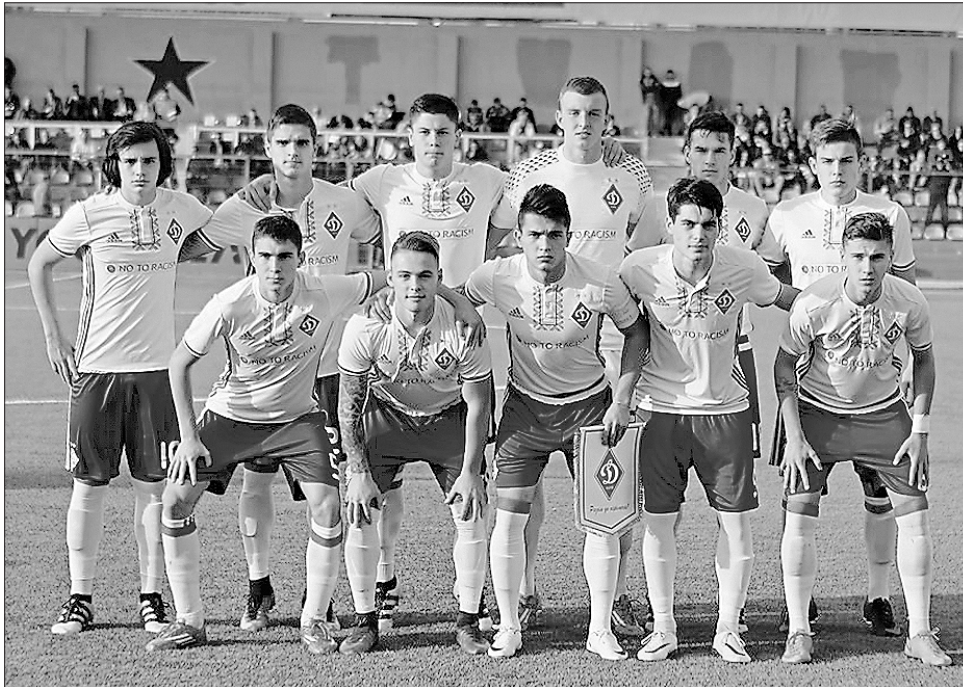
Отака вона — свіжа динамівська кров

Утім, кадрові проблеми у команді Сергія Реброва почалися не вчора. Та чи могло «Динамо» з таким перелицюванням складу боротися за вище місце в групі В Ліги чемпіонів? Можливо. Якби дали змогу суперникам. Однак гравці «Наполі», «Бешикташа» і «Бенфіки» — професіонали, а не благодійники.