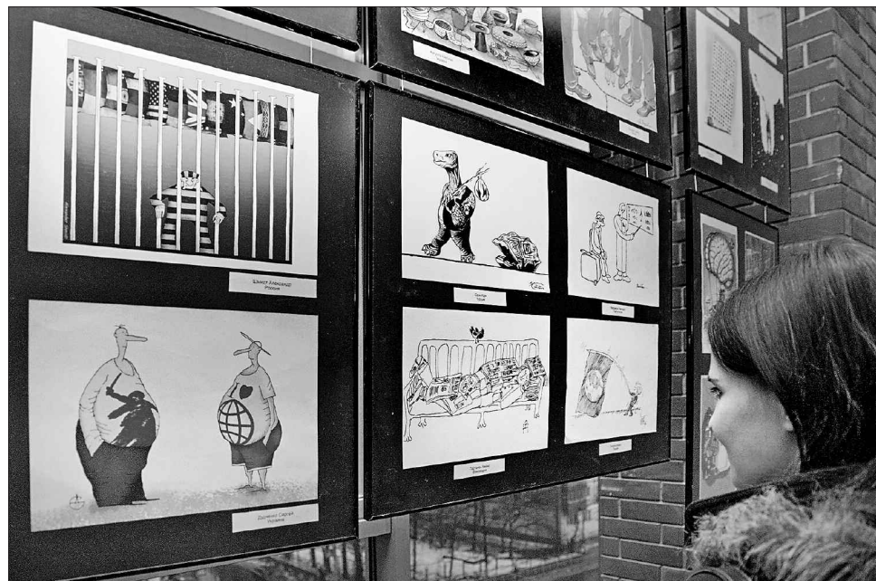
Бажаєте свіженького? Оглядайте-смійтеся й будьте здорові!

ня. Насправді все набагато складніше, настільки, що немає відповідей і рекомендацій, як це втілити в життя, і чи варто взагалі втілювати. Може бути так, як свого часу один великий вождь сказав: «Наша мета зрозуміла, завдання визначене. До роботи, товариші!». А потім довів світ до межі тер-