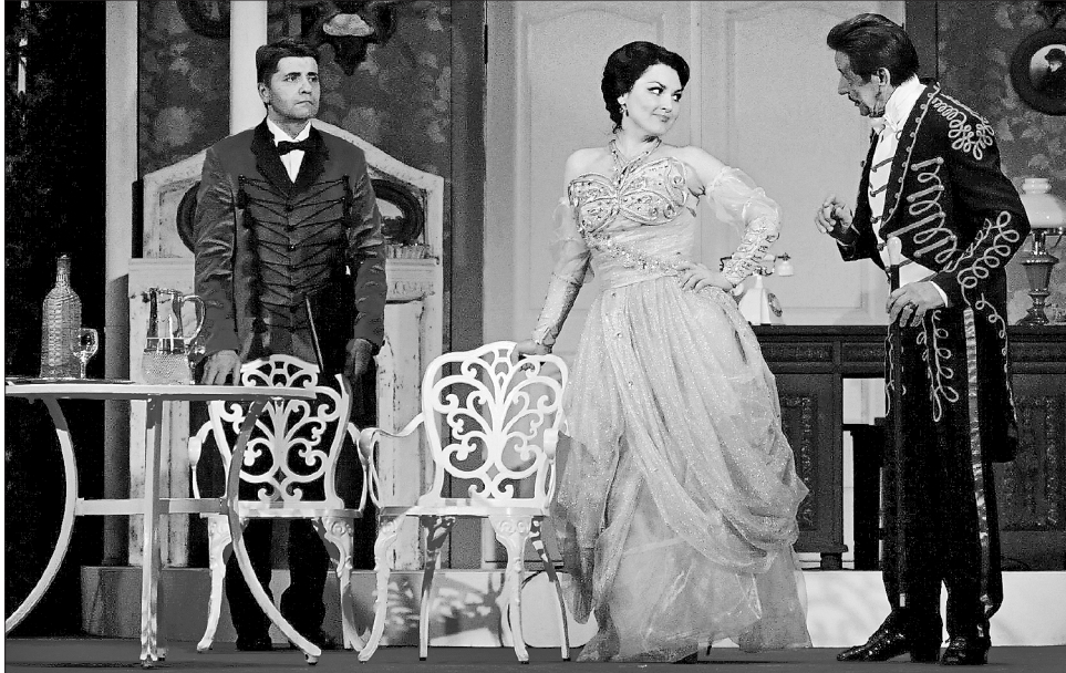
На цій сцені головна героїня оперети Імре Кальмана Валерія Туліс таки знайшла своє справжнє кохання!

Осучаснена «Графиня Маріца» — неперевершена, складна для виконання й чутлива для осягнення оперети. Про це не раз сказали й під час пресконференції художній керівник Національної оперети режисер-постановник Богдан Струтинський, лібретист Яна Іваницька, диригент-постановник Святослав Литвиненко, художник-постановник Олександр Білозуб. За якісь півгодини до початку однієї з прем'єр сезону до представників преси звертався і Надзвичайний і Повноважний Посол Угорщини в Україні Ерно Кешкен. Цього вечора усі причетні до виходу в світ «Графині Марі-