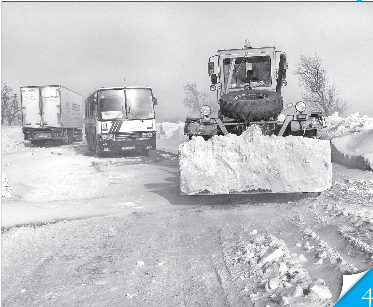
3 перших годин негоди рятувальні служби почали розчищати дороги і допомагати тим, хто опинився у складній ситуації

НЕГОДА. Паралізований транспорт, закриті школи, майже тисяча населених пунктів без світла — такі наслідки першого снігу