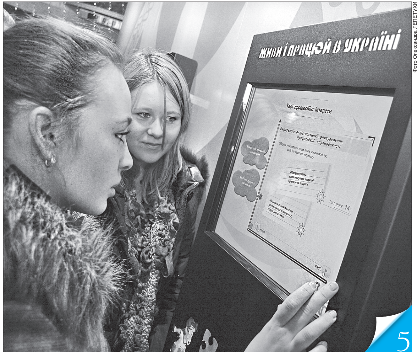
Маючи затребуваний фах та приборкавши надмірні амбіції, знайти роботу в Україні молодим нескладно