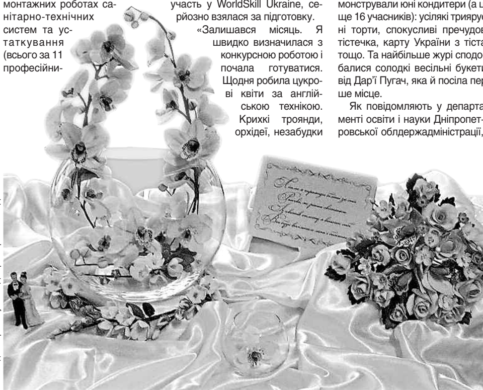
Робота переможниці міжнародного конкурсу професійної майстерності Дар'ї Пугач — справжній витвір мистецтва

«Залишався місяць. Я швидко визначилася з конкурсною роботою і почала готуватися. Щодня робила цукрові квіти за англійською технікою.