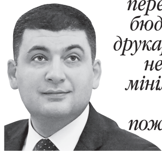
Прем'єр-міністр про рішення, яке відкриває шлях детінізації реального сектору

ВОЛОДИМИР ГРОЙСМАН: «Жодних перевищень дефіциту бюджету або запуску друкарських верстатів не буде. Підвищення мінімальної зарплати прораховано. Це поживить зростання економіки».