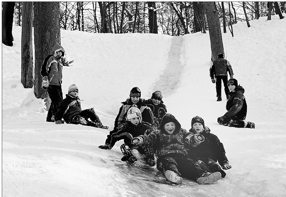
Хай би як супився листопад, він не годе зіпсувати радість шкільних канікул

В Україні свято Параски в особливий пошані. У церковних святцях це день пам'яті мучениці Параскеви-П'ятниці. За часів римського імператора Діоклетіана, жорстокого гонителя християн, дівчину Параскеву привели до правителя однієї з провінцій імперії. Він запропонував їй зректися Христа і вийти за нього заміж. Дівчина відмовилася зраджувати віру, за що й була страчена. Українське жіноцтво вшановує такі п'ятниці: перед Благовіщенням, десяту після Великодня, перед Трійцею, Успінням, Іваном Пісним, Воздвиженням, перед Різдом і Богоявленням, а також дві п'ятниці великопісні. У поминальні п'ятниці жінкам не можна шити, прясти, працювати на городі, споживати скоромну їжу. Якщо на Параски сонячно — зима буде тепла; хмарно — у грудні вдарять сильні