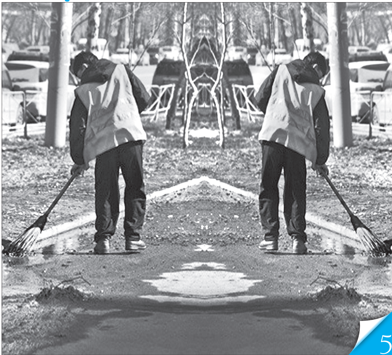
Колаж Ірини НАЗІМОВОЇ