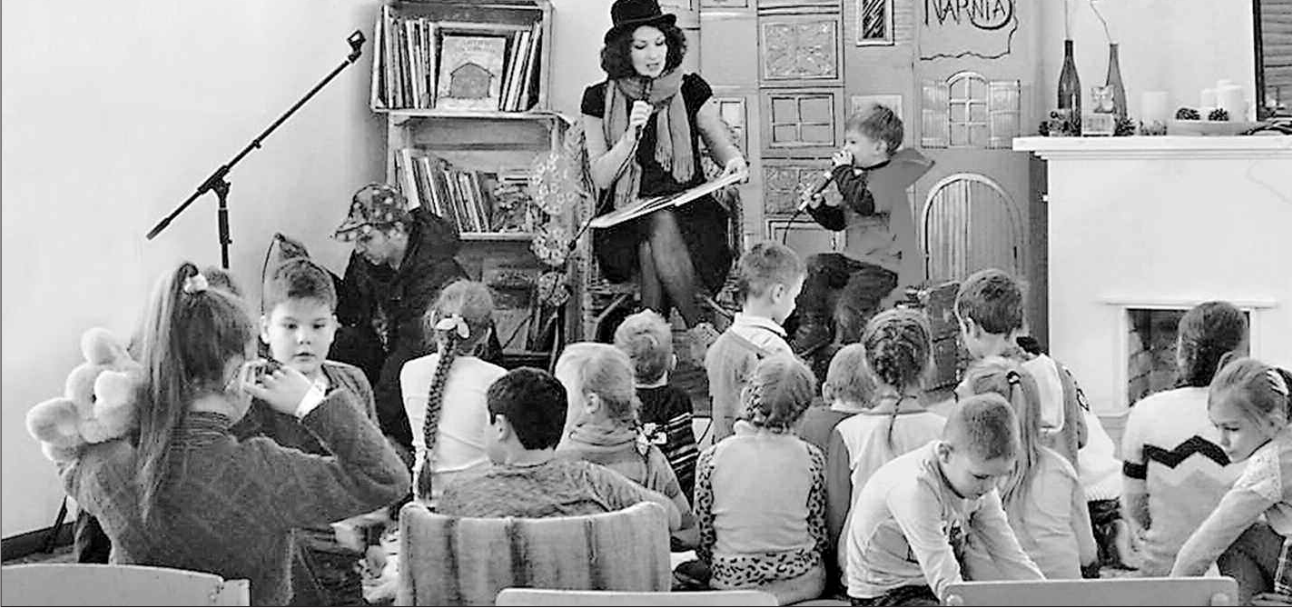
Найприскіпливіший читач той, який щойно навчився читати