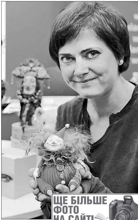
ЩЕ БІЛЬШЕ ФОТО НА САЙТІ

З НАС. Конкурси краси бувають різні: цікаві і смішні, чесні й не дуже. Та коли за моделей ляльки, є надія, що переможе справді найкраща. Цими днями в столиці проходить міжнародний салон авторських ляльок і виставка рукоділля та творчості «Золоті руки майстрів», родзинкою яких став конкурс краси «Міс лялька-2016». Вперше відвідувачі та журналісти разом обирали найкрасивішу серед авторських ляльок. Крім того, «Золоті руки майстрів» зібрали понад 270 учасників з 15 країн світу. Вони представляють, зокрема, роботи з бісероплетіння, вишивки стрічкою тощо та проводять майстер-класи. Також під одним дахом зібралися виробники матеріалів, сучасних інструментів для творчості та хобі. Салон ляльки організовано вже удванадцять, а рукоділля — учотирнадцять.