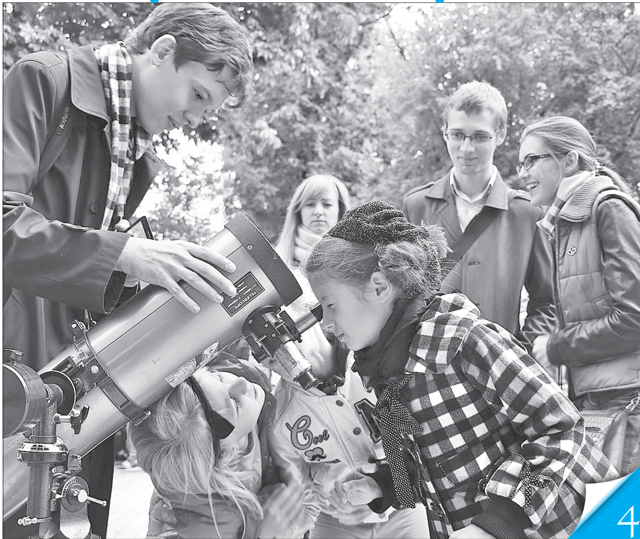
Завдяки громадським активістам школярі з окупованих територій здобували знання з астрономії та інших предметів у Міжнародній зеленій школі в Карпатах

МАЙБУТТЯ. Молодь з Донбасу й Криму дедалі частіше обирає якісну українську освіту