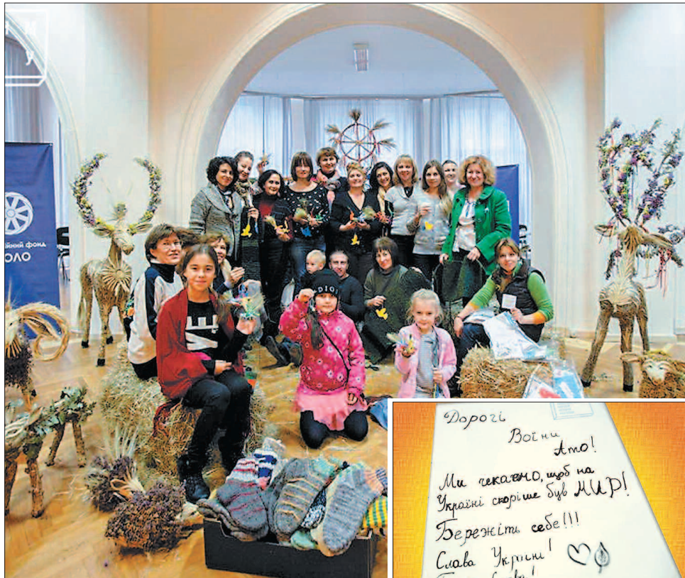
Таке-от товариство, здатне наснажити бійців

«Ми плели сітки, кікморі, теплі пояси, писали листи, робили мотанки, обереги, фігурки з сіна. Все, що виготовлено, сплетено, розмальовано, написано, попрямує на фронт зігрівати наших бійців й огортати їх нашою любов'ю як найкращим оберегом. Одна з головних цілей цієї акції — зіб-