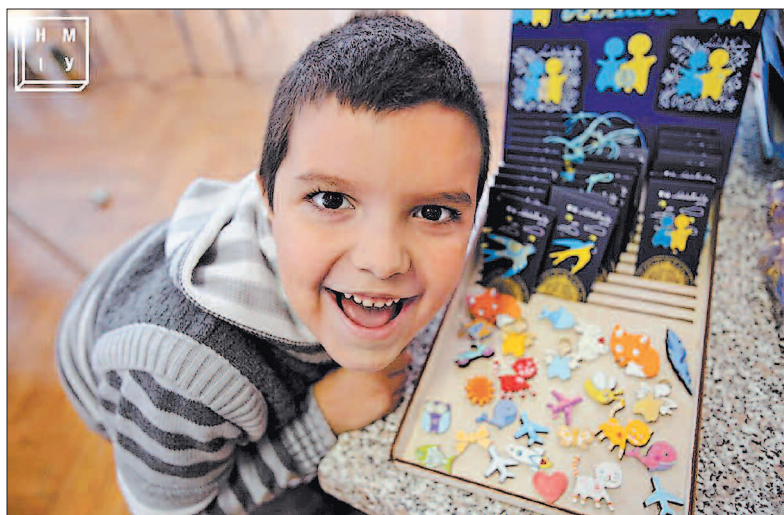
Діти вкладають у свої подарунки найкращі емоції

Під час проведення акції в приміщенні Національного музею історії України було гамірно від дитячих голосів, пахло сіном, усіх зігрівали тепло софітів телевізійників і неймовірна енергетика добрих людей, яким не байдужі долі тих, хто захищає їх на фронті. 14 жовтня у день Святої Покрови і День захисника України це тепло волонтери обцяють передати воїнам з рук у руки, від серця до серця.