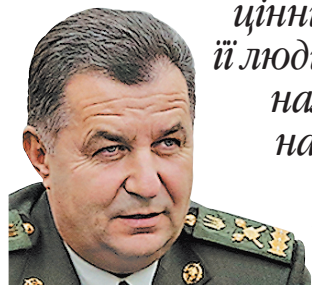
Міністр оборони про особливості характеру захисників України

СТЕПАН ПОЛТОРАК: «Найбільша цінність нашої армії — її люди, які патріотично налаштовані, здатні на мужні та героїчні вчинки, здатні швидко навчатися нового».