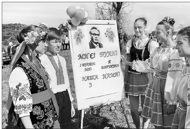
Юні учасники літературного журналу «Читаємо твори Івана Багряного»