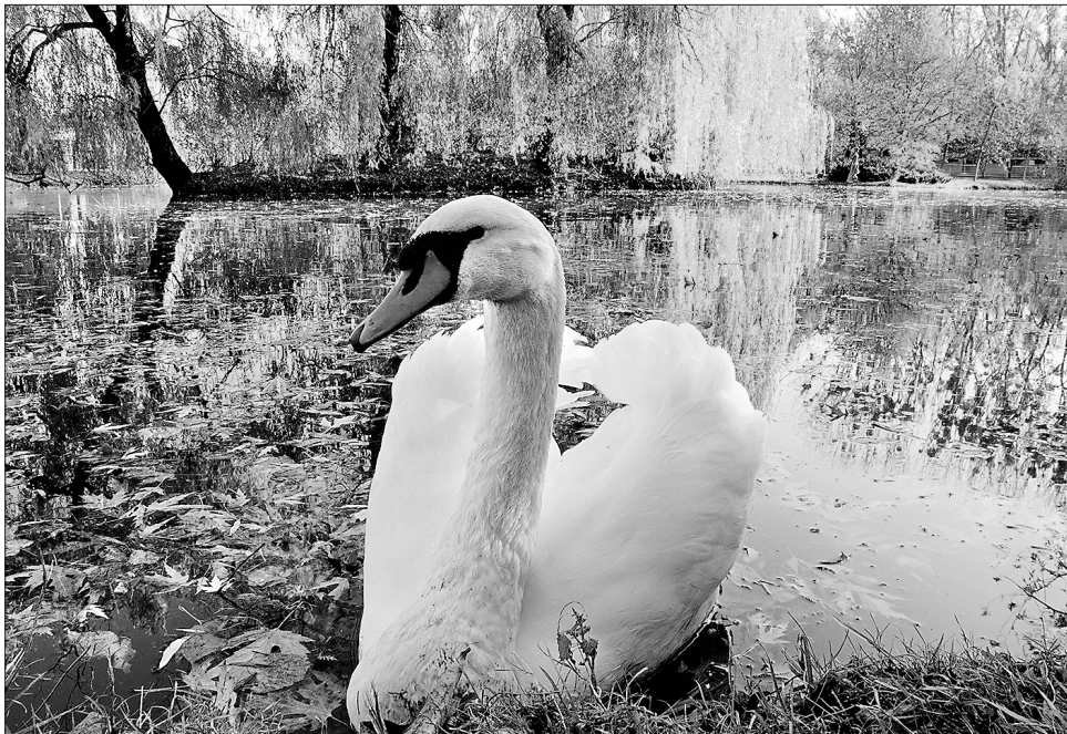
Білий лебідь — птах витривалий. Якщо не відлітає у теплі краї, знаходить водойму, що не замерзає, і зимує там

За народними прикметами, якщо на Мокрини (1 серпня) сонячний день — багато сонячних днів буде у вересні, жовтні і навіть у листопаді. Щодо вересня, то мокрина прикмета (був погожий день) підтвердилася. За прогнозами синоптиків сонячним буде і жовтень. Щоправда, погода буде прохолодною упродовж місяця. З кожним днем ознаки осені відчутніші. Природа і люди готуються до зими. Може, тому у жовтні здавна було мало релігійних свят, з якими народні синоптики пов'язували прогнози на наступні зиму, весну і літо. Знаковими для таких прогнозів старі люди вважають свята: Ярини (1), Дениса (3), Сергія-Капустяника (8), Покрови Пресвятої Богородиці (14).