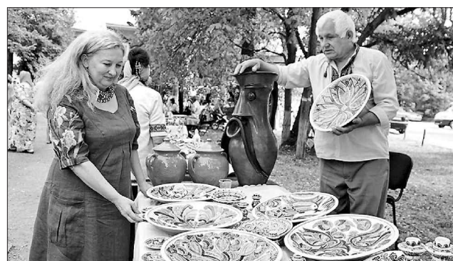
Гості гончарного фестивалю залюбки долучалися до народного мистецтва