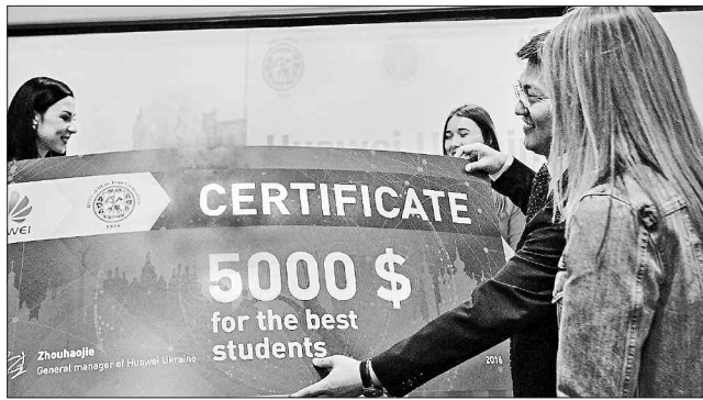
Вкладені в освіту тисячі обернуться мільйонами

ПЕРСПЕКТИВА. Національний технічний університет України «Київський політехнічний інститут ім. Ігоря Сікорського» та Науковий парк «Київська політехніка» підписали днями меморандум про співпрацю з одним зі світових лідерів у сфері інформаційно-комунікаційних технологій — компанією Huawei. Документ визначає основні принципи співпраці в трьох напрямках — освіті, науці та інноваціях.