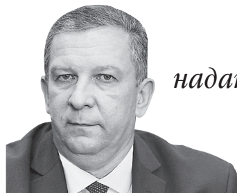
Міністр соціальної політики про монетизацію пільг

АНДРІЙ РЕВА: «Необхідно перейти від системи надання преференцій до грошових компенсацій за ті чи ті пільги».