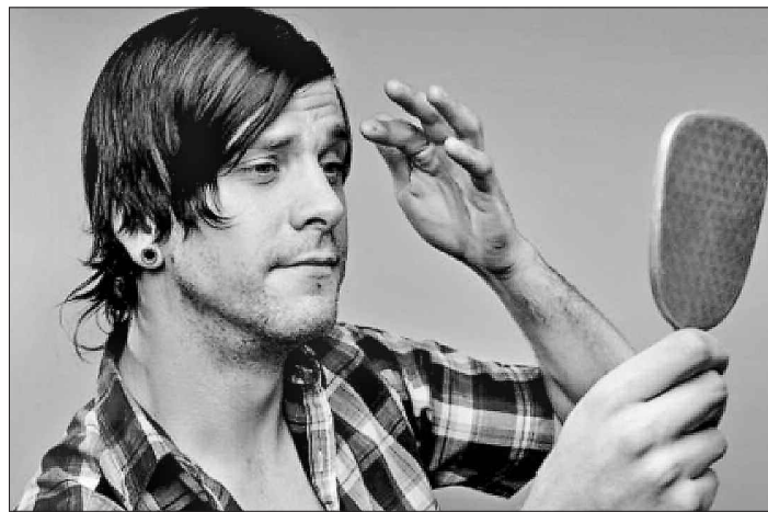
Хто у світі всіх миліший?