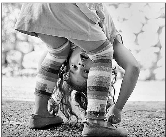
А так речі здаються більшими...

ВІДПОЧИНОК. Попри те, що новий навчальний рік вже розпочався, для 45 школярів із Запоріжжя та області триває справжній літній відпочинок. Їх запросив у гості до Хорватії місцевий футболіст, екс-граєць київського «Арсеналу», а нині агент ФІФА Івица Пиріч. Діти отримали нагоду відпочити на знак шанси до героїчних подвигів їхніх батьків — учасників АТО, частина з яких загинули в зоні бойових дій. У Загребі українську делегацію із Запоріжжя та Києва привітав посол України в Республіці Хорватія Олександр Левченко. Зустріч розпочалася на вулиці Українській біля Каштана Дружби — символу відносин України та Республіки Хорватія. Продовжили урочистості біля пам'ятника Тарасові Шевченку. Школярі декламували вірші Кобзаря й співали «Україна — це ми», а також разом із послом виконали гімн України. Зі столиці Хорватії українські учні прибули на відпочинок до міста Оміш (Сплітсько-Далматинська жупанія), що на мальовничому Адріатичному узбережжі.