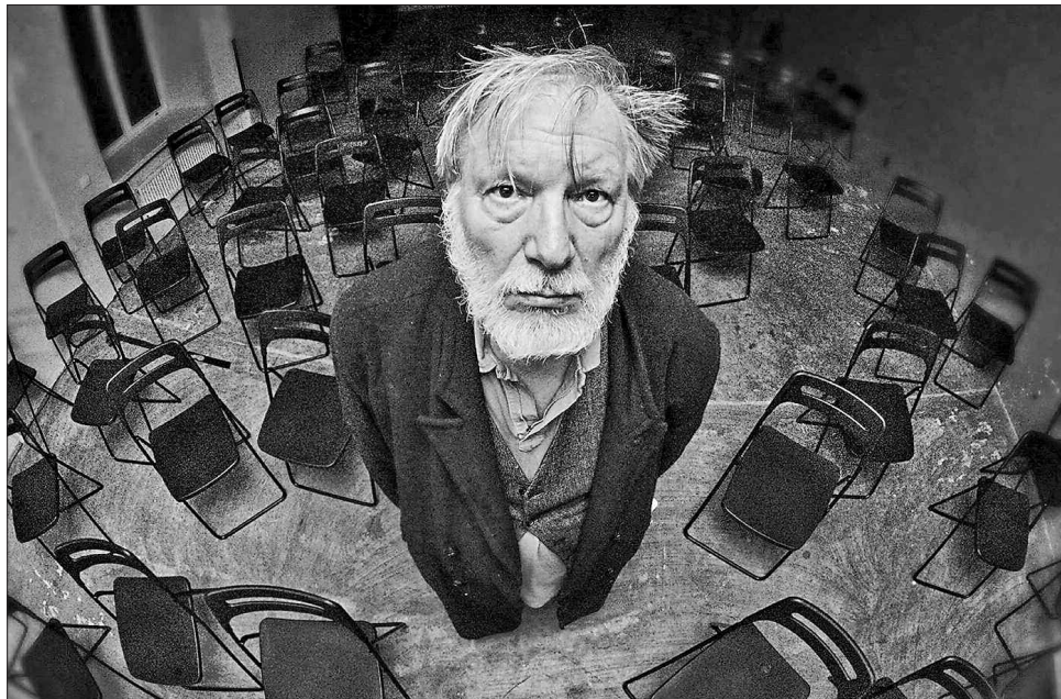
У проекті «Литовський фокус» актор Юозас Будрайтіс, відомий широкій публіці за стрічками «Даунхаус», «Ніхто не хотів помирати», «Колекціонер», зіграв у виставі одного з найяскравіших європейських театральних режисерів Оскараса Коршуноваса «Остання стрічка Креппа»

Гогольфесту виявилось тісно в означених 10 днях. Вже 15 вересня показали найкращу вільноську виставу 2010 року «На дні». На відкритті відбулася київська прем'єра хореодрами «Близькість», яка