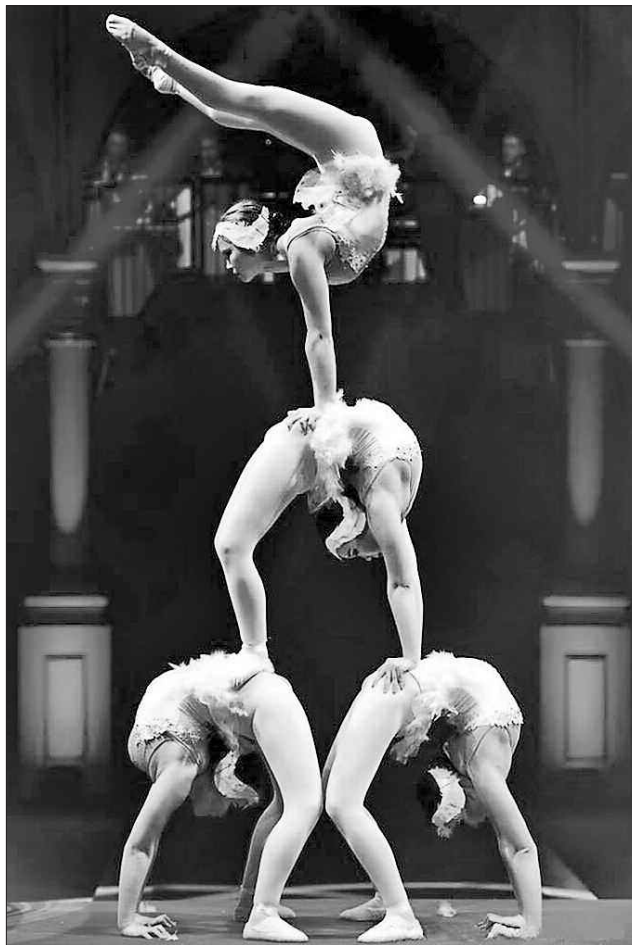
Дівчата-лебеді з Монгольського цирку демонструють глядачам еквилібр з каучуком