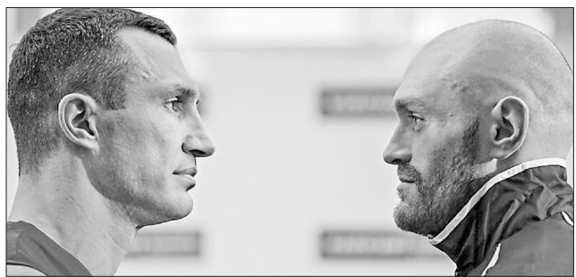
Ганна РОМАШКО для «Урядового кур'єра»

На нинішніх Іграх Україна серед фаворитів у загальному медальному заліку.