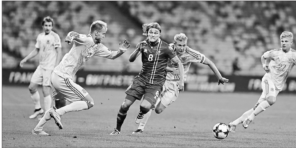
Наші футболісти стверджують, що стають колективом однодумців

На жаль, старт матчу господарі провалили. Вже на 5-й хвилині наш захист помилився і Фіннбогасон з другої спроби пробив П'ятова. Зважаючи на те, як ісландці вміють захищатися, що надуспішно демонстрували під час Євро, нашим потрібно доводити свій клас. Тривалий час гра в українців не клеїлася через величезну кількість помилок під час переходу з оборони в атаку. Тому чекати на гол унаслідок акцентованих комбінаційних дій на половині поля суперника було марно. Допомогли випадок й індивідуальна майстерність Ракицького та Ярмоленка. Перший «вистрілював» метрів із 30-ти, Хальдоурсон відбив м'яч перед собою, а Ярмоленко забив перший гол